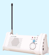
特定小電力無線装置 B1500