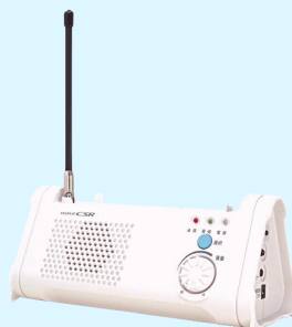
特定小電力無線装置 B1500